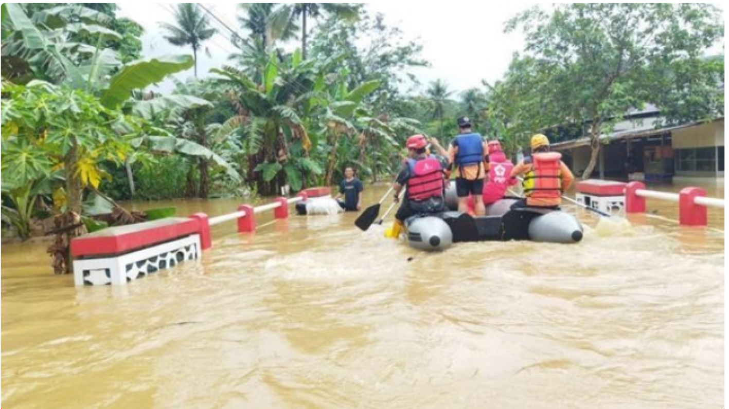
Banjir di Desa Sitarjo, Kecamatan Sumbermanjing Wetan, Kabupaten Malang akibat meluapnya Sungai Panguluran