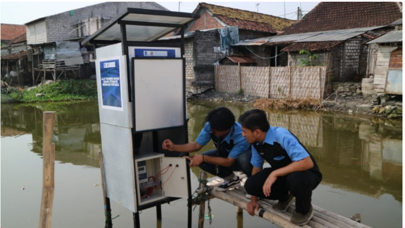
Tim KKN Abmas ITS saat menunjukkan cara kerja alat pakan udang otomatis di Desa Tambakploso, Kabupaten Lamongan

SURABAYA – Tim Kuliah Kerja Nyata Pengabdian Masyarakat (KKN Abmas) Institut Teknologi Sepuluh Nopember (ITS) menciptakan alat pemberi pakan udang otomatis untuk budi daya tambak udang di Dusun Gabus, Desa Tambakploso, Kabupaten Lamongan. Alat berbasis Internet of Things (IoT) ini diberikan untuk meningkatkan potensi setempat.