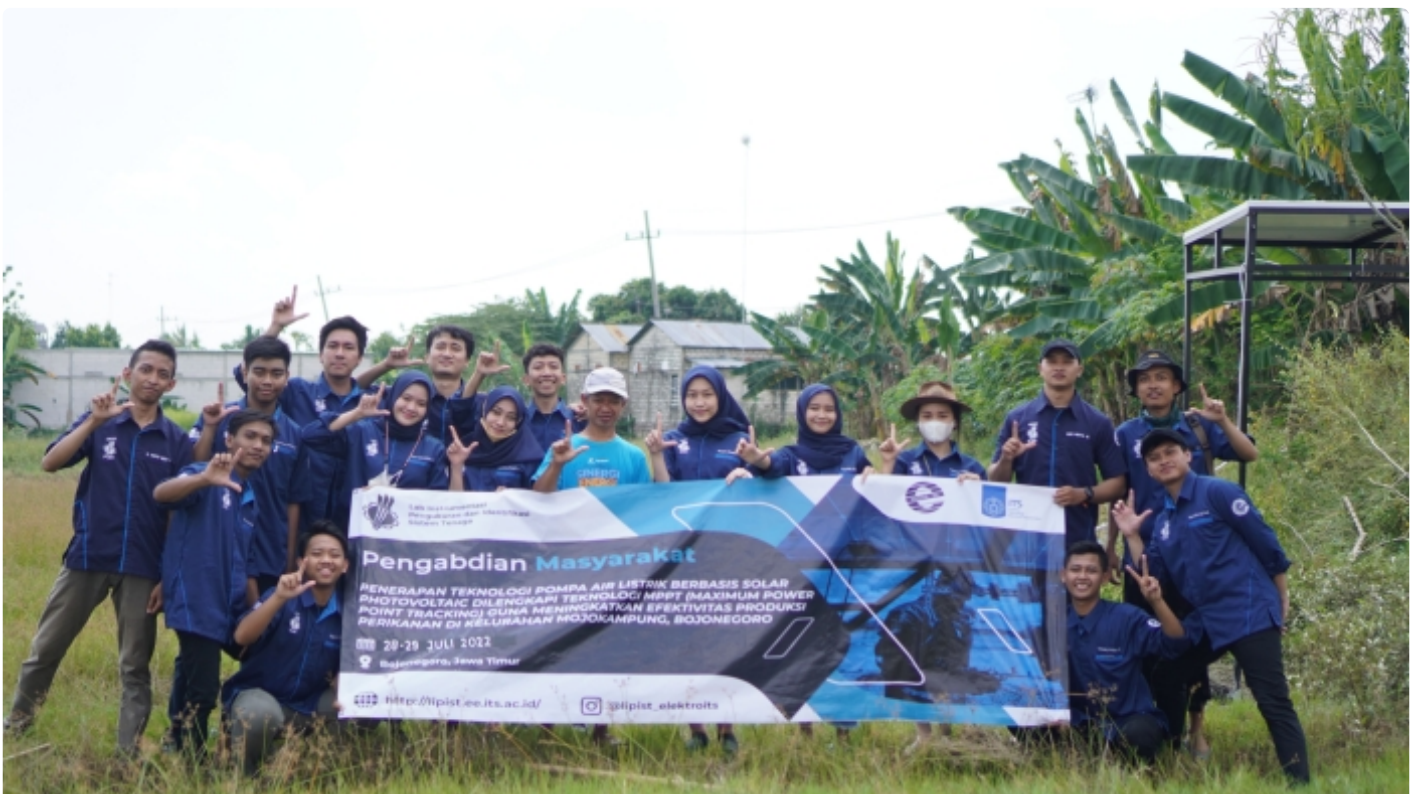
Tim KKN Abmas ITS yang menggarap pompa air berbasis fotovoltaik bersama petani tambak Kelurahan Mojokampung

SURABAYA — Penggunaan energi fosil yang semakin tinggi mengakibatkan naiknya harga bahan bakar tersebut. Hal ini pun tidak terlepas pada kebutuhan warga yang bermata pencaharian dalam sektor perikanan. Maka dari itu tim Kuliah Kerja Nyata (KKN) Institut Teknologi Sepuluh Nopember (ITS) menciptakan pompa air berbasis teknologi fotovoltaik dengan Maximum Power Point Tracking (MPPT) guna efektifkan produksi perikanan setempat.