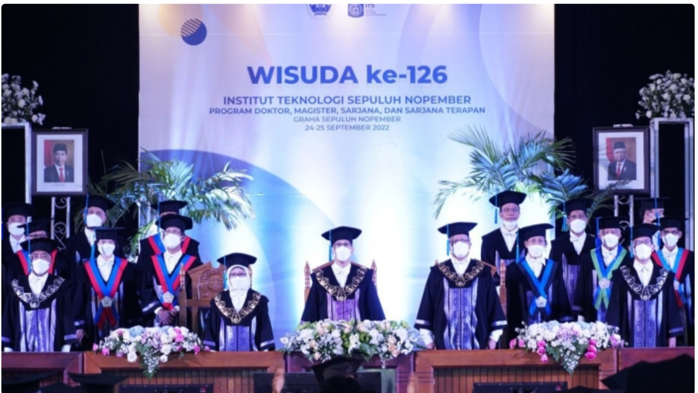
Rektor ITS beserta jajarannya pada prosesi Wisuda ke-126

SURABAYA – Institut Teknologi Sepuluh Nopember (ITS), kembali menggelar prosesi Wisuda ke-126 secara memikat sepenuhnya untuk kali pertama, setelah beberapa digelar secara berani dan hybrid (daring dan luring). Wisuda yang diselenggarakan selama dua hari, pada Sabtu-Minggu, 24-25 September 2022 ini, dilaksanakan dengan protokol kesehatan (prokes) yang ketat di Gedung Graha Sepuluh Nopember ITS.