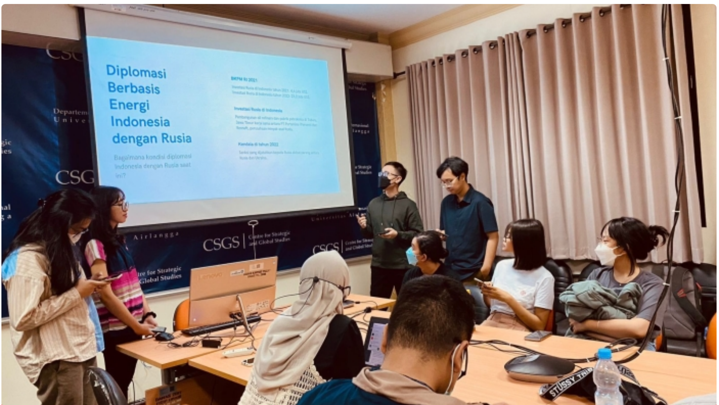
Sesi Presentasi dan Diskusi IRCOM x FPCI Airlangga di Ruang Cakra, FISIP

SURABAYA – Melambungnya harga Bahan Bakar Minyak (BBM) di Indonesia semakin membebani perekonomian masyarakat yang berusaha pulih dari dampak pandemi. Untuk menekan hal tersebut pemerintah didorong mencari alternatif sumber minyak mentah murah. Salah satu alternatifnya adalah membeli minyak murah dari Rusia. Namun, ditengah gejolak politik yang terjadi, langkah tersebut dapat menjadi boomerang tersendiri.