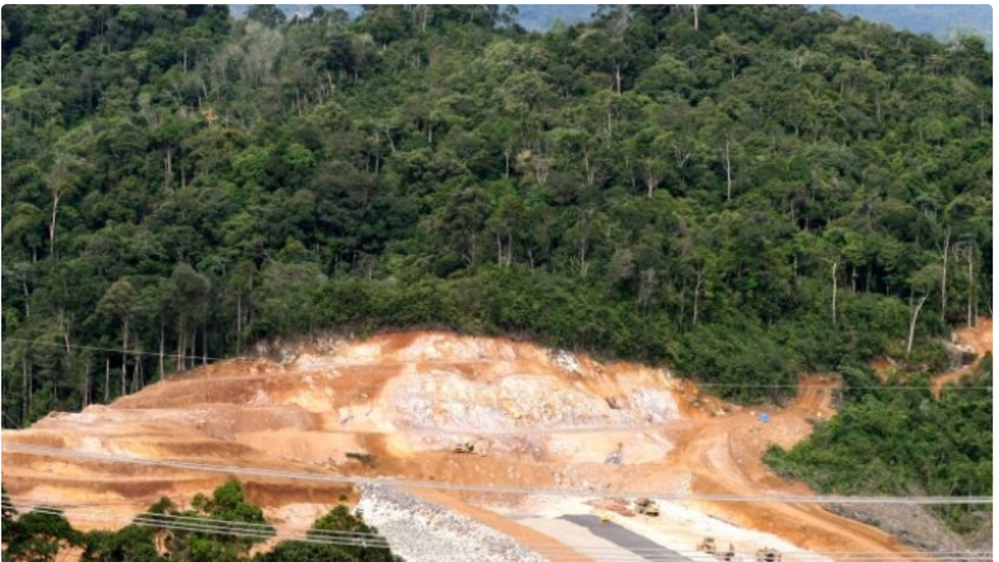
Tambang emas yang beroperasi di hutan Sumatera Utara.

SURABAYA – Ekonom lingkungan Stefan Giljum et al. mengeluarkan penelitian yang berjudul “A Pantropical Assessment of Deforestation Caused by Industrial Mining.” Disitu disimpulkan bahwa Indonesia menempati posisi pertama dalam melakukan deforestasi untuk keperluan industri pertambangan dalam periode 2000-19.