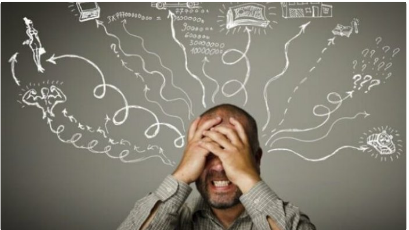
Ilustrasi gangguan kecemasan

SURABAYA - Rasa cemas merupakan salah satu perasaan yang kerap dirasakan manusia. Namun apabila berlebihan, perasaan ini dapat menghantui pikiran hingga mengacaukan aktivitas sehari-hari. Menyorot hal ini, Psikolog Medical Center Institut Teknologi Sepuluh Nopember (ITS) Fatimatuzzakiyah SPsi MPsi Psikolog bagikan tip untuk bersahabat dengan rasa cemas berlebih.